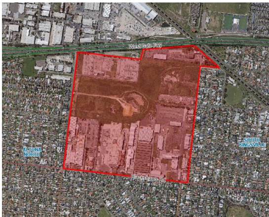
Χάρτης 1 Τομέας 15 και περίχωρα