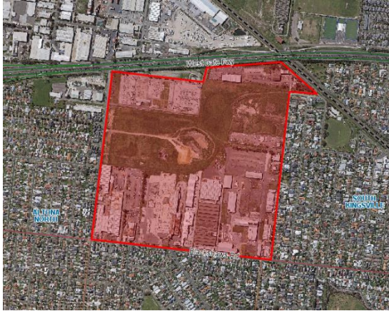
Bản đồ 1 Khu vực 15 và vùng lân cận