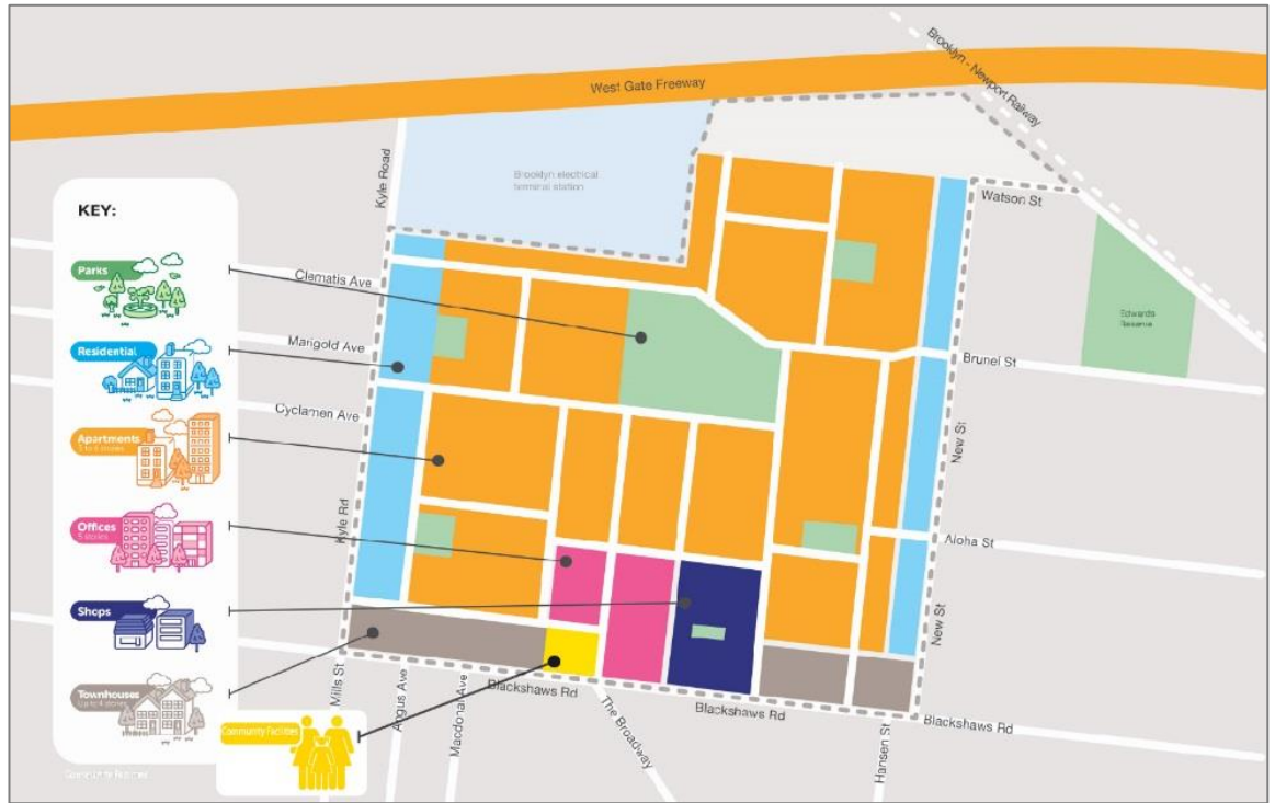
الخريطة 2 - خريطة استخدام الأراضي